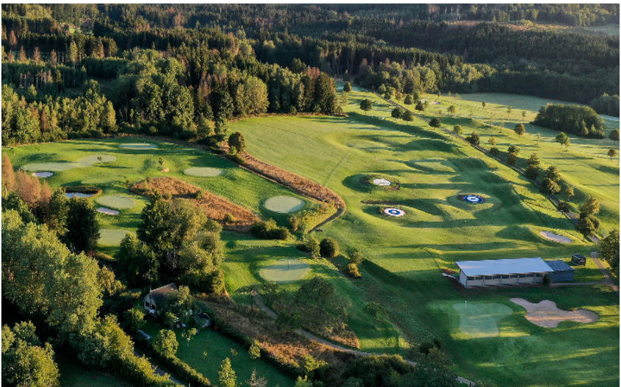
9-Loch Kurzplatz und Driving Range